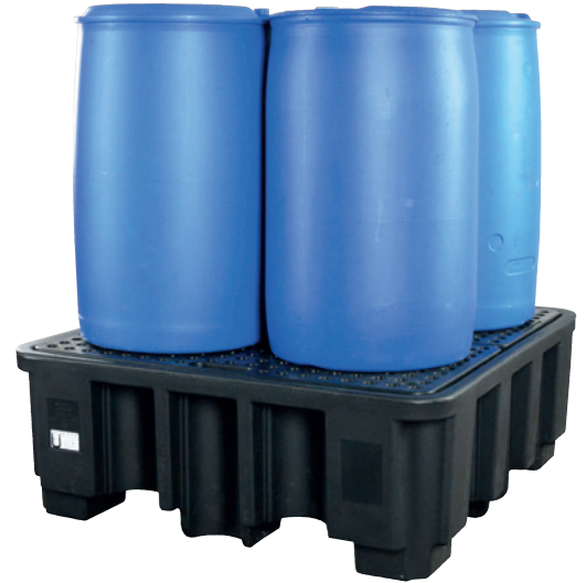
PE-200-3, mit PE-Lochplatte, Artikel-Nr. P70-2026-A