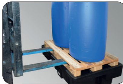
Sicheres Abstellen der Europalette