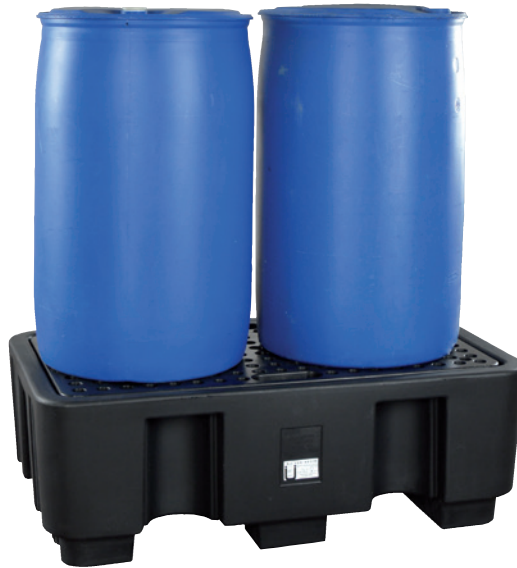
PE-200-2, mit PE-Lochplatte, Artikel-Nr. P70-2021-A