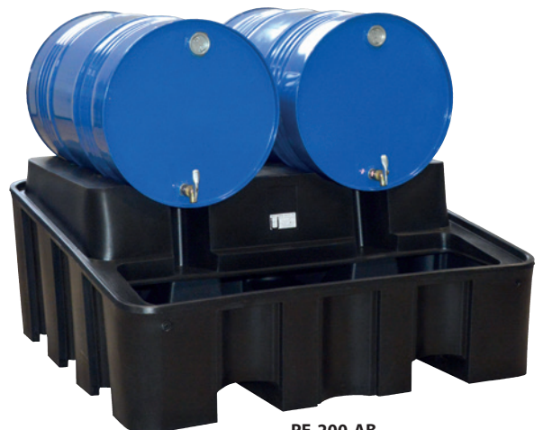
PE-200-AB, mit integriertem Abfüllbock, Artikel-Nr. P70-2027-A