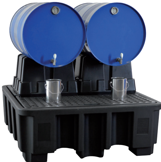
PE-200-3, Artikel-Nr. P70-2026-A, mit FB 2-Kombi, Artikel-Nr. P70-2033-A