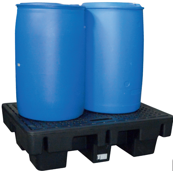
PE-200-5, mit PE-Lochplatte, Artikel-Nr. P70-2025-A