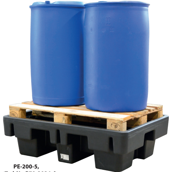
PE-200-5, Artikel-Nr. P70-2024-A