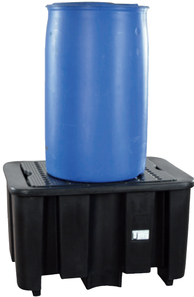
PE-200-1, mit PE-Lochplatte, Artikel-Nr. P70-2020-A