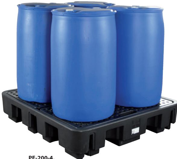
PE-200-4, mit PE-Lochplatte, Artikel-Nr. P70-2022-A