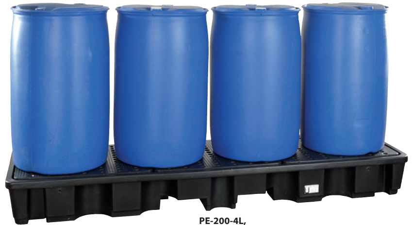
PE-200-4L, mit PE-Lochplatte, Artikel-Nr. P70-2023-A