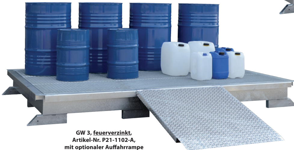
GW 3, feuerverzinkt, Artikel-Nr. P21-1102-A, mit optionaler Auffahrrampe

i Besonders großes Auffangvolumen und großzügig dimensionierte Lagerfläche!