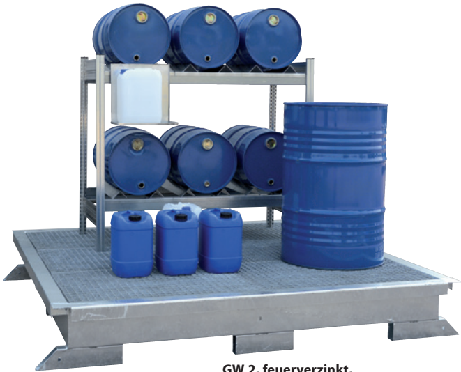
GW 2, feuerverzinkt, Artikel-Nr. P21-1101-A