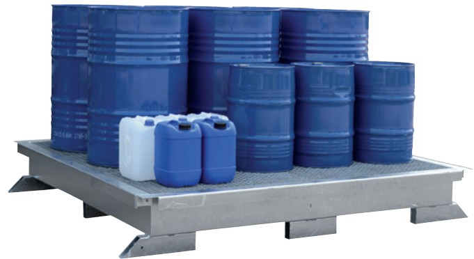
GW 2, feuerverzinkt, Artikel-Nr. P21-1101-A