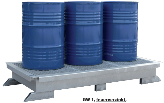
GW 1, feuerverzinkt, Artikel-Nr. P21-1100-A