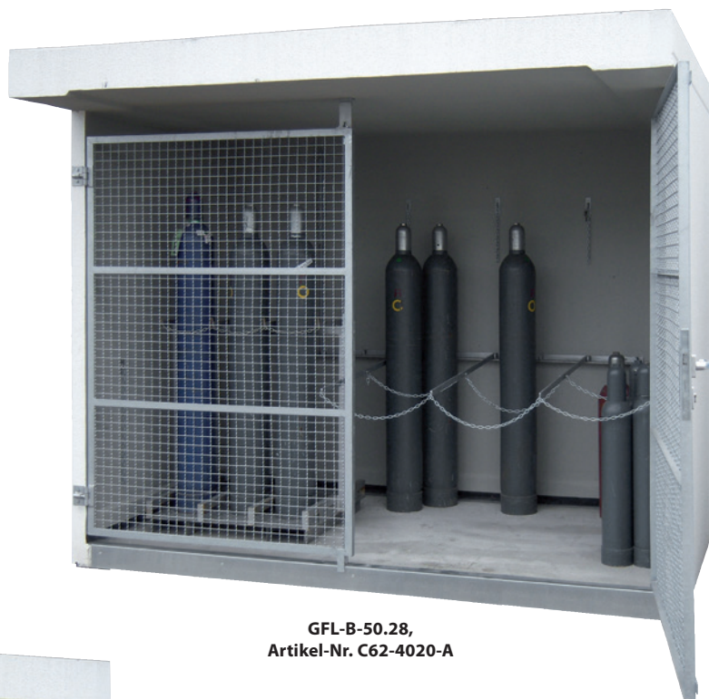
GFL-B-50.28, Artikel-Nr. C62-4020-A

Durch die beweglichen Kragarme ist eine flexible Lagerung von Einzelflaschen und/oder Gasflaschenpaletten möglich.