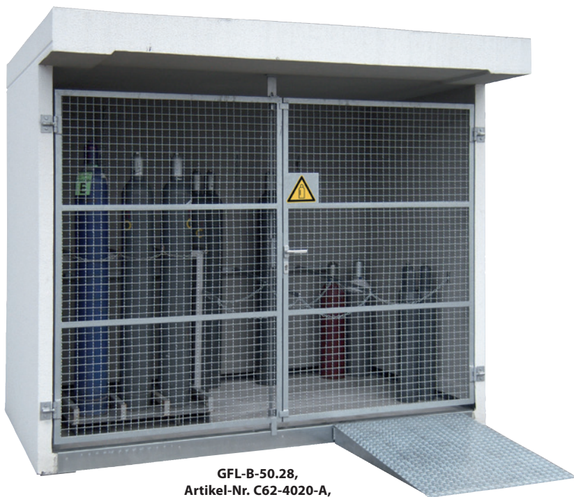
GFL-B-50.28, Artikel-Nr. C62-4020-A, mit optionaler Auffahrrampe