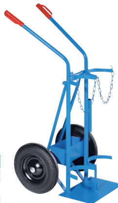
GFW50-VO, Artikel-Nr. B69-6434-A