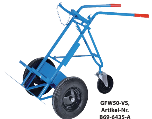
GFW50-VS, Artikel-Nr. B69-6435-A