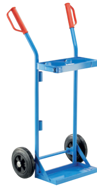
GFR10-V, Artikel-Nr. B69-6432-A