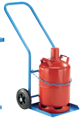
GFR27-V, Artikel-Nr. B69-6433-A