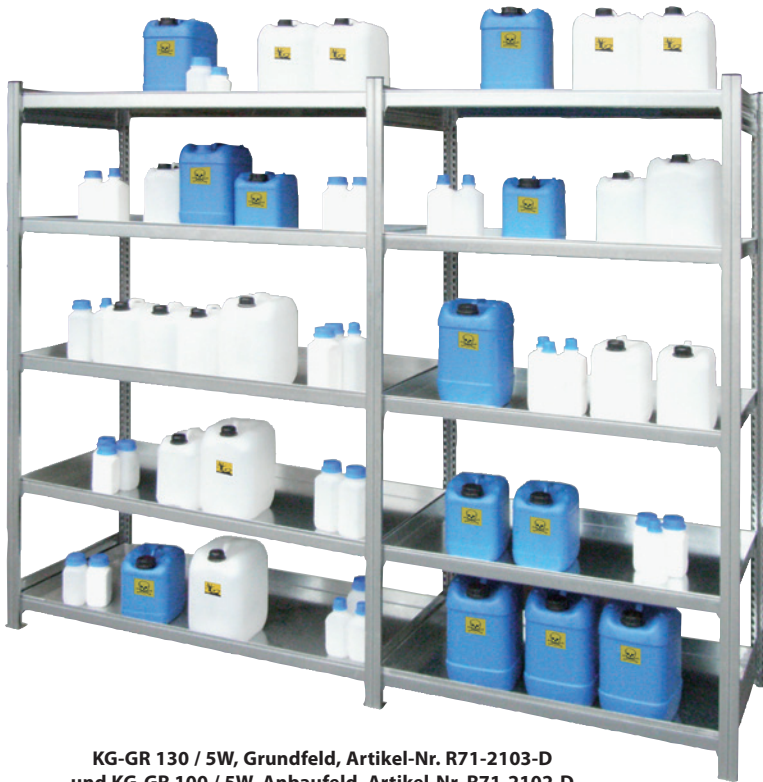
KG-GR 130 / 5W, Grundfeld, Artikel-Nr. R71-2103-D und KG-GR 100 / 5W, Anbaufeld, Artikel-Nr. R71-2102-D