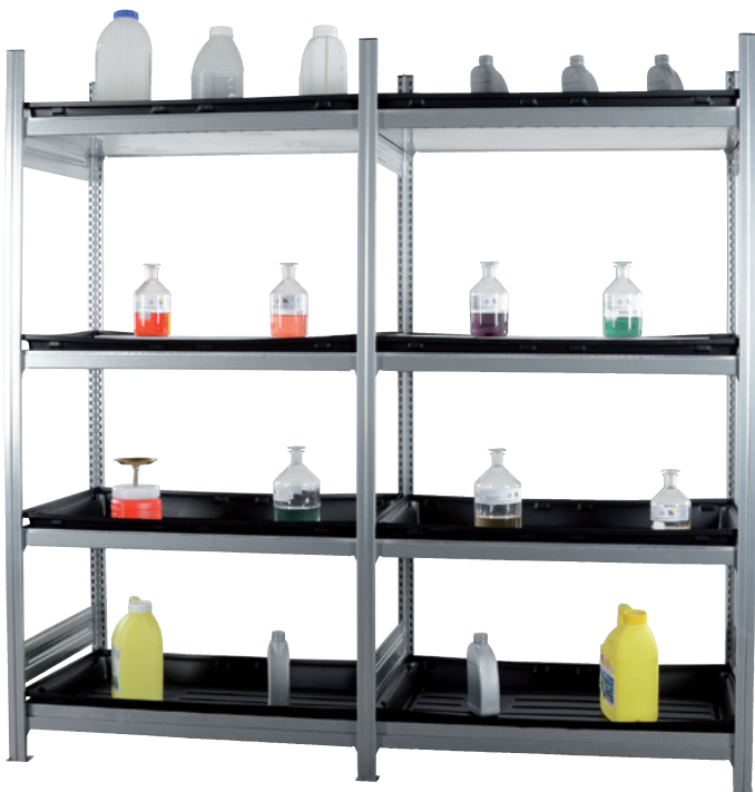
KG-GR 100 / 4WPE, Grundfeld, Artikel-Nr. R71-2124-A und KG-GR 100 / 4WPE, Anbaufeld, Artikel-Nr. R71-2125-A