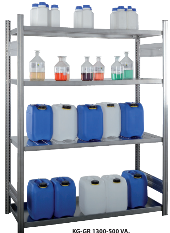
KG-GR 1300-500 VA, Grundfeld, Artikel-Nr. R71-3124-A