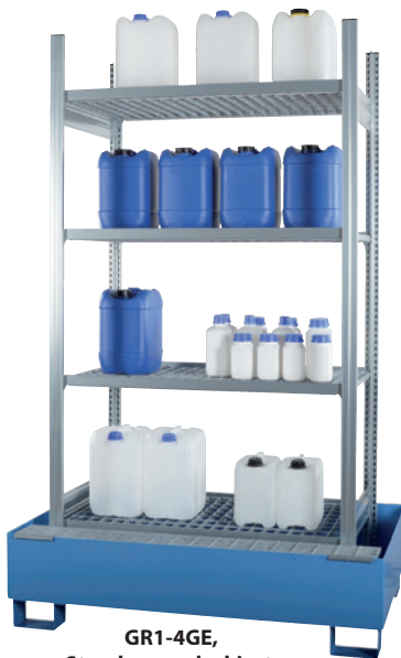
GR1-4GE, Standwanne lackiert, Artikel-Nr. R71-2060-C

i Hervorragend geeignet zur Lagerung von Pflanzenschutzmitteln!