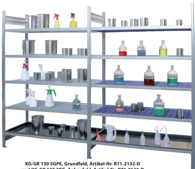
KG-GR 130 5GPE, Grundfeld, Artikel-Nr. R71-2132-D und KG-GR 130 5PG, Anbaufeld, Artikel-Nr. R71-2143-D