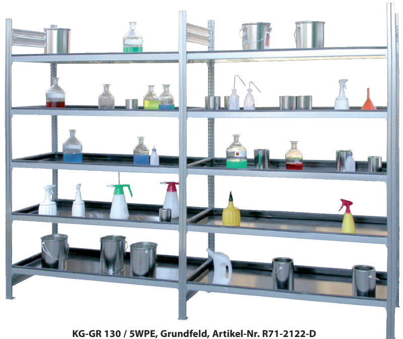
KG-GR 130 / 5WPE, Grundfeld, Artikel-Nr. R71-2122-D und KG-GR 130 / 5WPE, Anbaufeld, Artikel-Nr. R71-2123-D