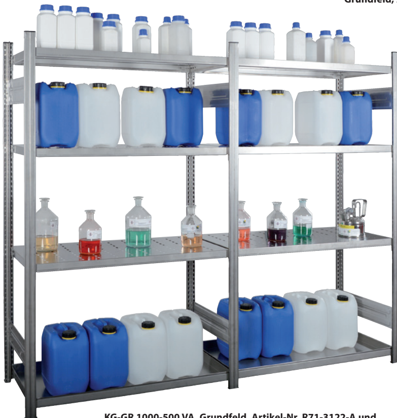
KG-GR 1000-500 VA, Grundfeld, Artikel-Nr. R71-3122-A und KG-GR 1000-500 VA, Anbaufeld, Artikel-Nr. R71-3123-A