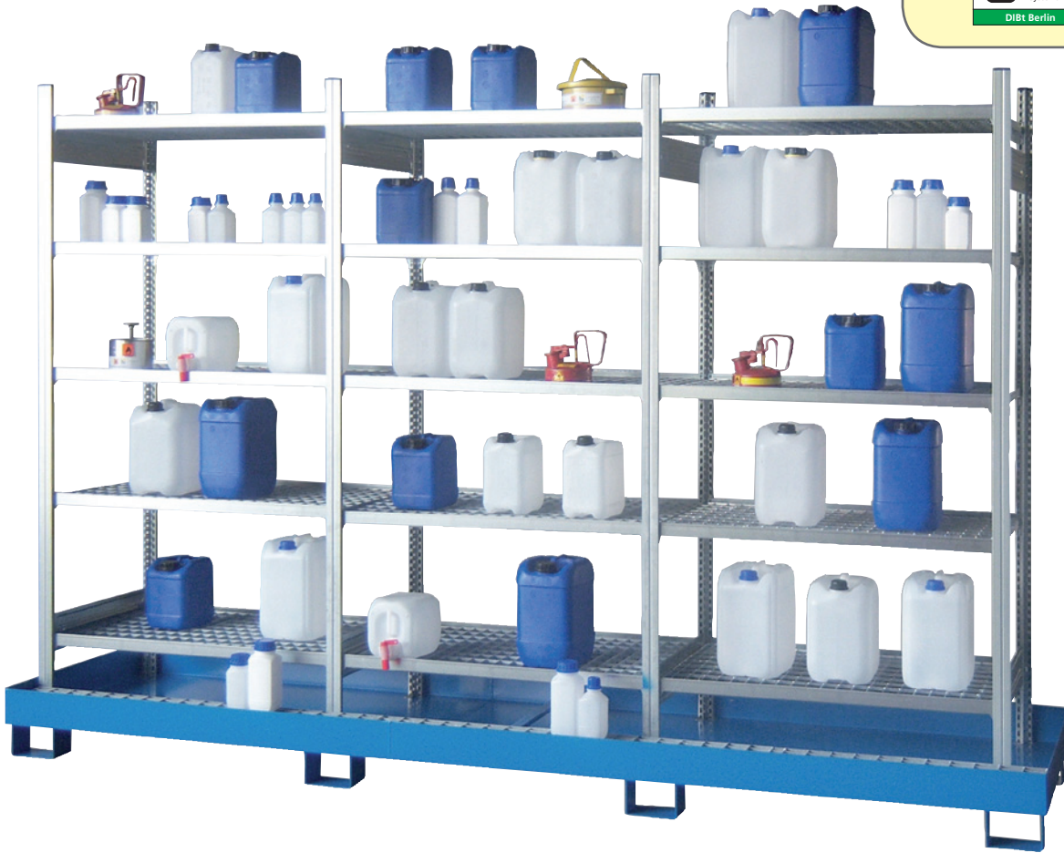
GR3-5GE, Standwanne lackiert, Artikel-Nr. R71-2091-C

Unsere Kleingebinde-Gefährstoffregale sind auch in vielen weiteren Varianten lieferbar: