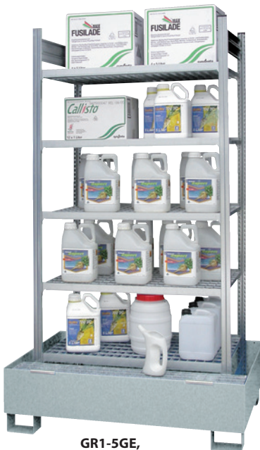
GR1-5GE, Standwanne feuerverzinkt, Artikel-Nr. R71-1061-C