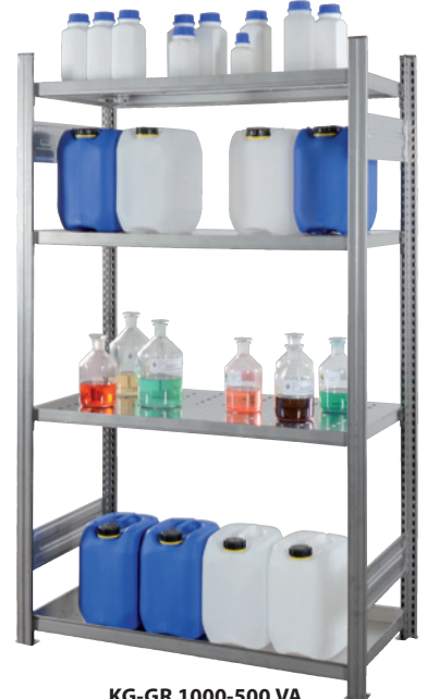
KG-GR 1000-500 VA, Grundfeld, Artikel-Nr. R71-3122-A