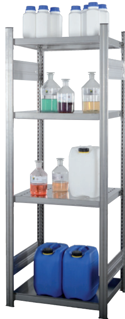
KG-GR 600-500 VA, Grundfeld, Artikel-Nr. R71-3120-A