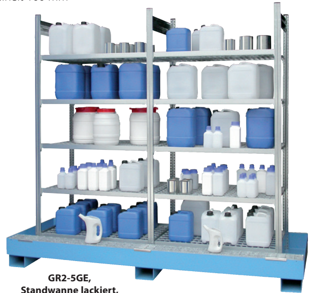
GR2-5GE, Standwanne lackiert, Artikel-Nr. R71-2081-C