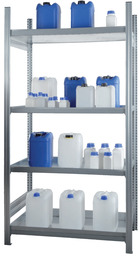
KG-GR 100 / 4W, Artikel-Nr. R71-2181-D