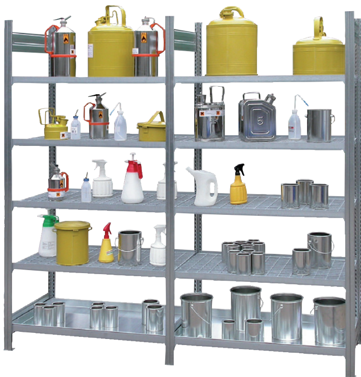
KG-GR 100 / 5G, Grundfeld, Artikel-Nr. R71-2110-D und KG-GR 100 / 5G, Anbaufeld, Artikel-Nr. R71-2111-D