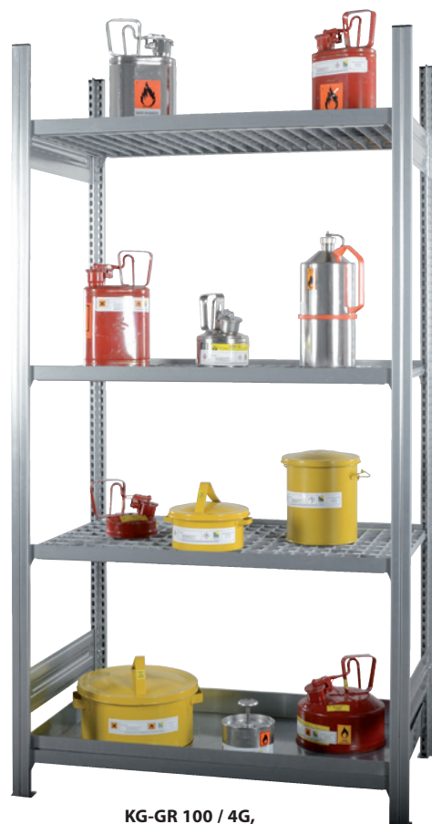
KG-GR 100 / 4G, Artikel-Nr. R71-2190-D