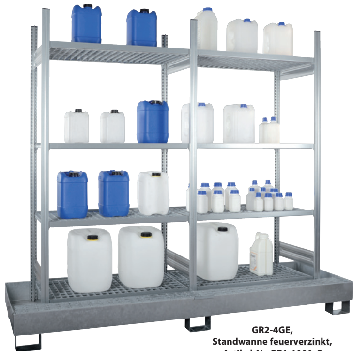
GR2-4GE, Standwanne feuerverzinkt, Artikel-Nr. R71-1080-C