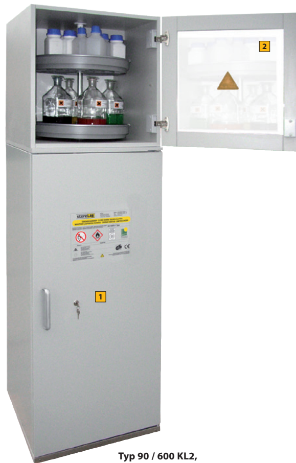
Typ 90 / 600 KL2, Artikel-Nr. B80-2889-A