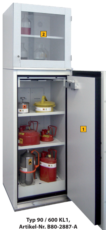
Typ 90 / 600 KL1, Artikel-Nr. B80-2887-A