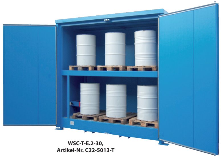
WSC-T-E.2-30, Artikel-Nr. C22-5013-T