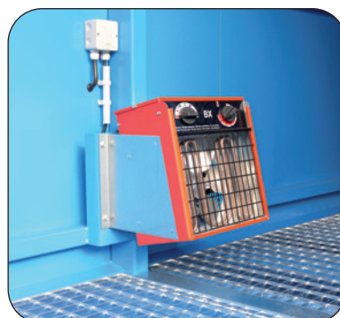
Umluftheizung nicht Ex-geschützt